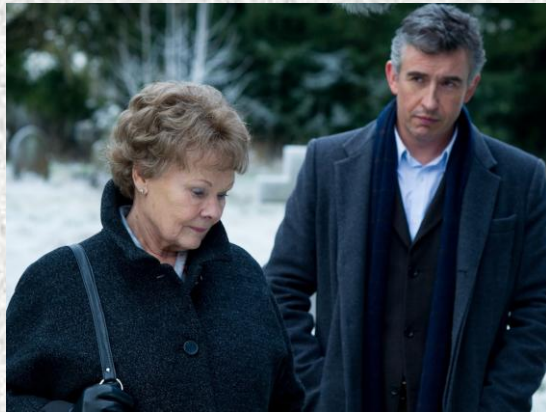
Judi Dench et Steve Coogan