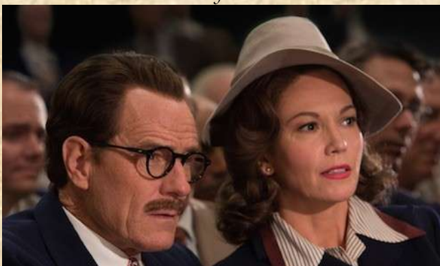
Le couple Trumbo : Bryan Cranston et Diane Lane