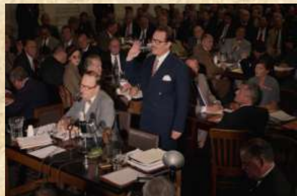
Dalton Trumbo est convoqué devant la commission d'activités anti-américaines