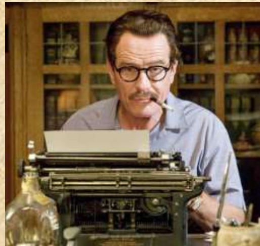
Bryan Cranston, alias Dalton Trumbo