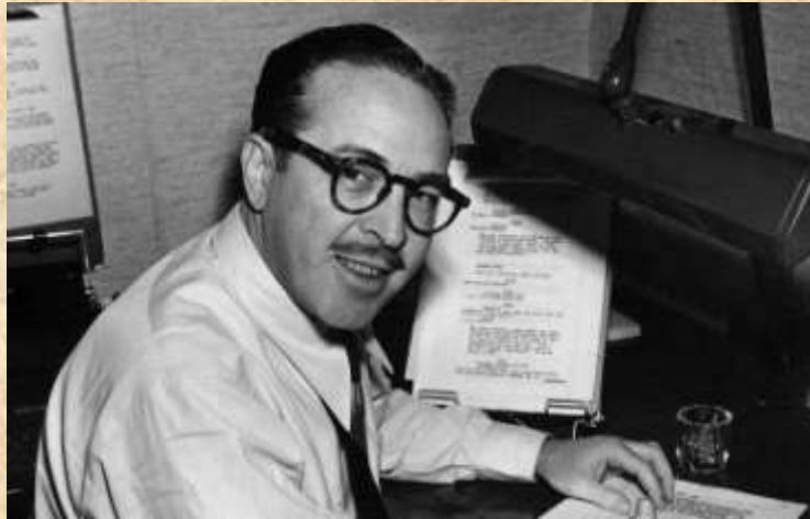
Le vrai Dalton Trumbo (1905-1976)