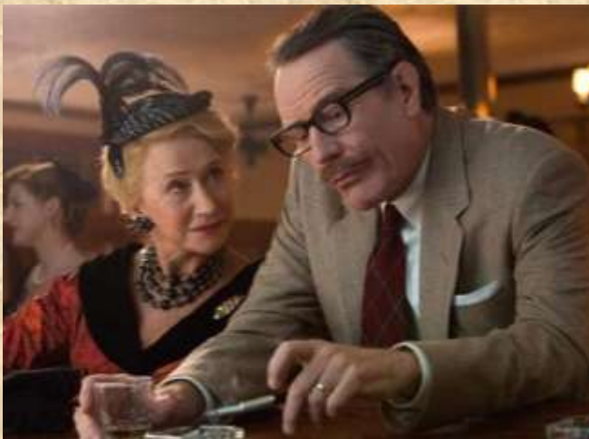
Dalton Trumbo en compagnie de Hedd Hopper (Helen Mirren), la virulente commère anti-communiste de Hollywood