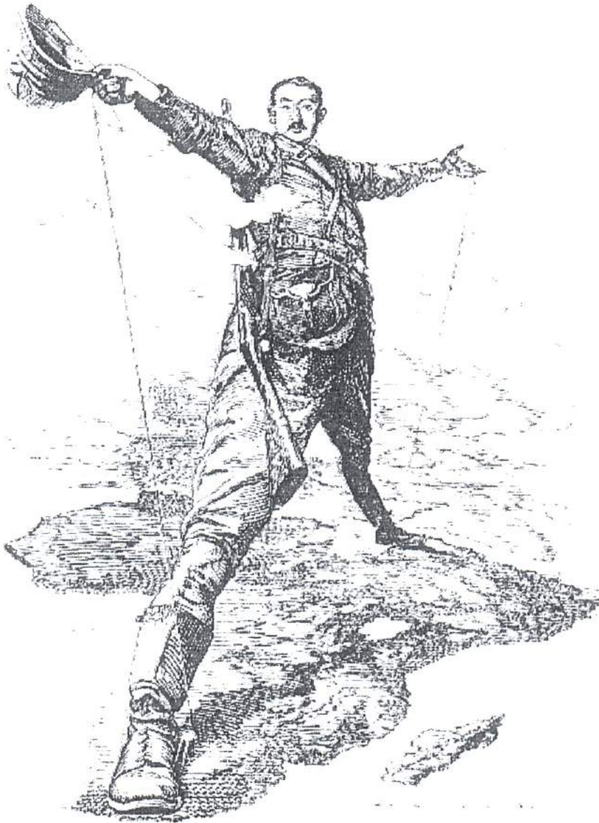
The Rhodes Colossus. Punch (December 1892), drawn by Edward Linley Sambourne