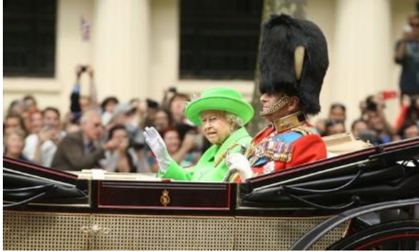
Trooping the colour parade marks Queen's 90th birthday

Display of military pomp and pageantry 1 in central London honours longest reigning and oldest monarch in British history