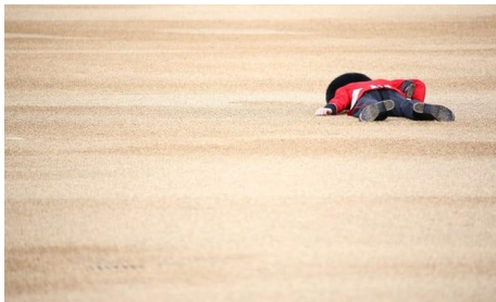
A guardsman collapsed during the ceremony at Horse Guards Parade.